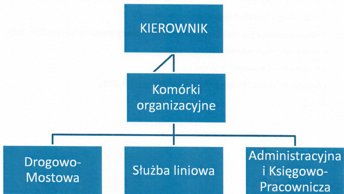
Rysunek nr 1. Schemat organizacyjny Powiatowego Zarządu Dróg w Grudziądzu

W PZD pracuje 16 osób, w tym 9 osób zatrudnionych jest na stanowiskach robotniczych.