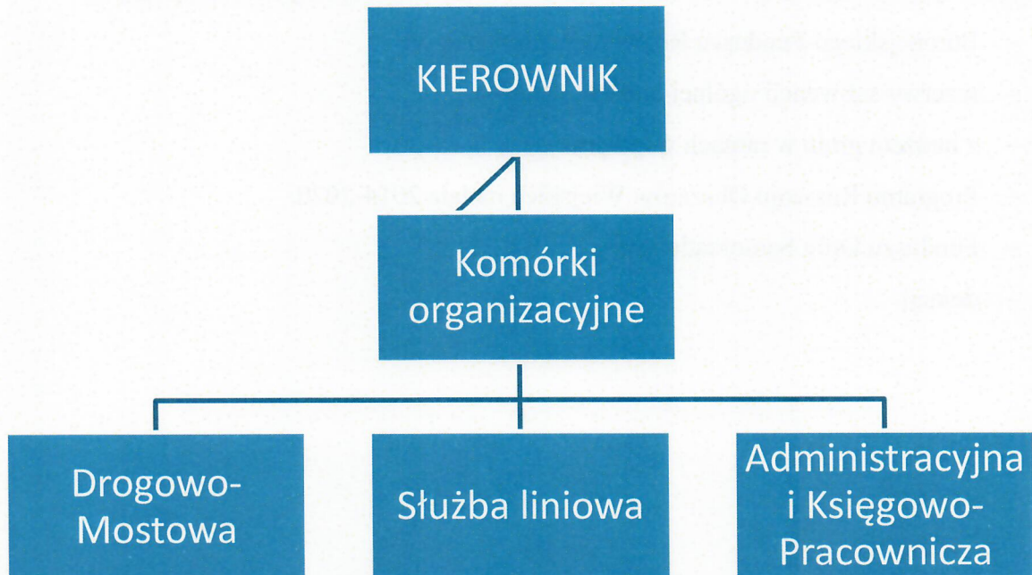
Rysunek nr 1. Schemat organizacyjny Powiatowego Zarządu Dróg w Grudziądzu

W PZD pracuje 16 osób, w tym 9osób zatrudnionych jest na stanowiskach robotniczych.